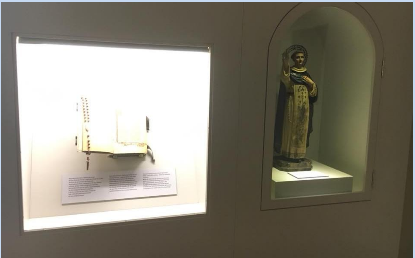
Cambrà destinada a la predicació de Sant Vicent Ferrer en Catí (1410).