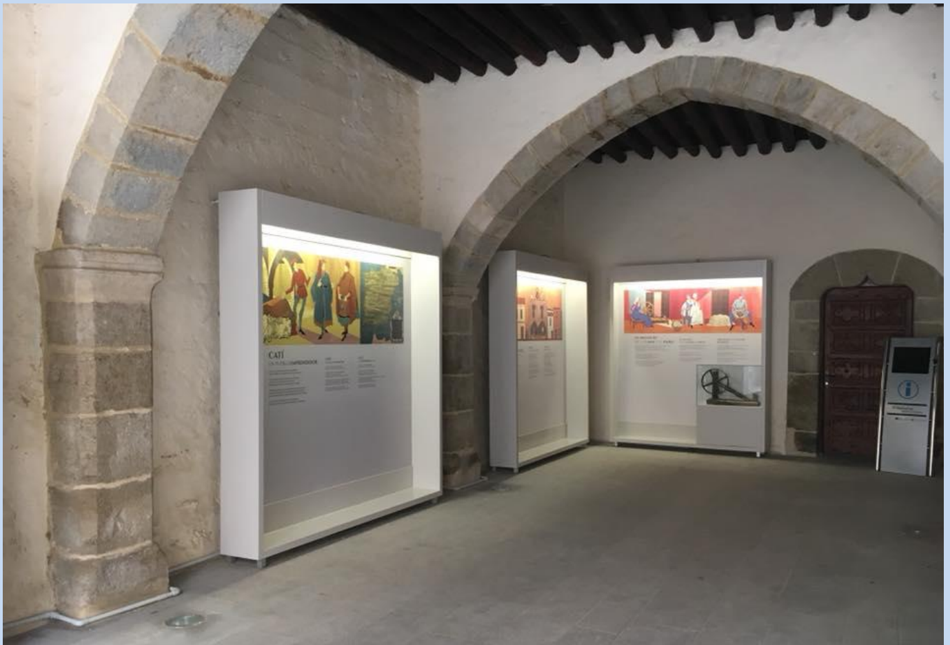
Taulers i aparell de vídeo sobre la història de Catí situats a La Llotja de la Casa la Vila,