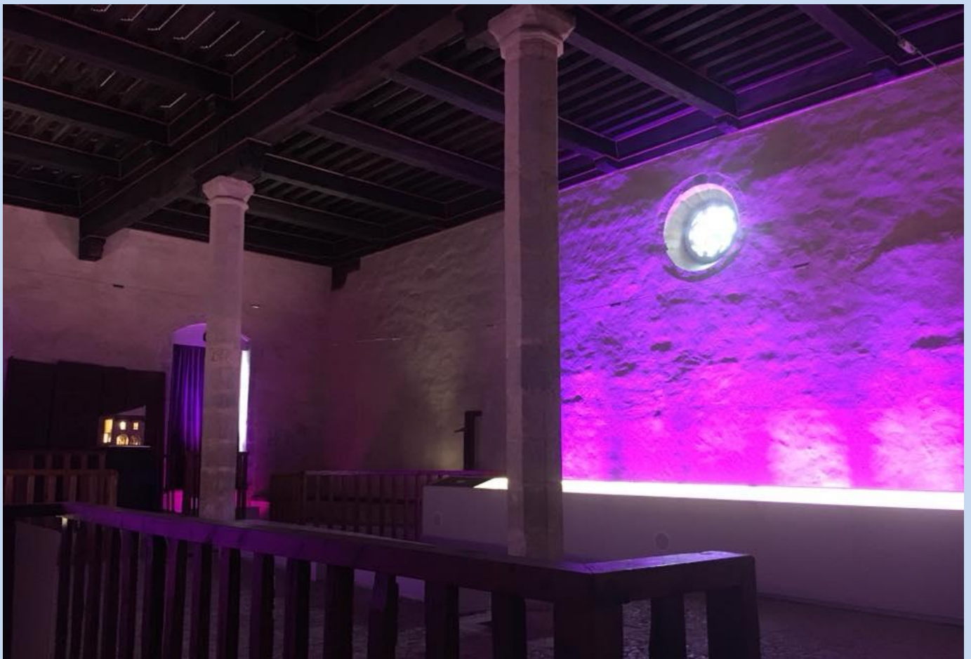
Llums decoratives sobre la paret lateral de l'òscul de la Sala la Vila.