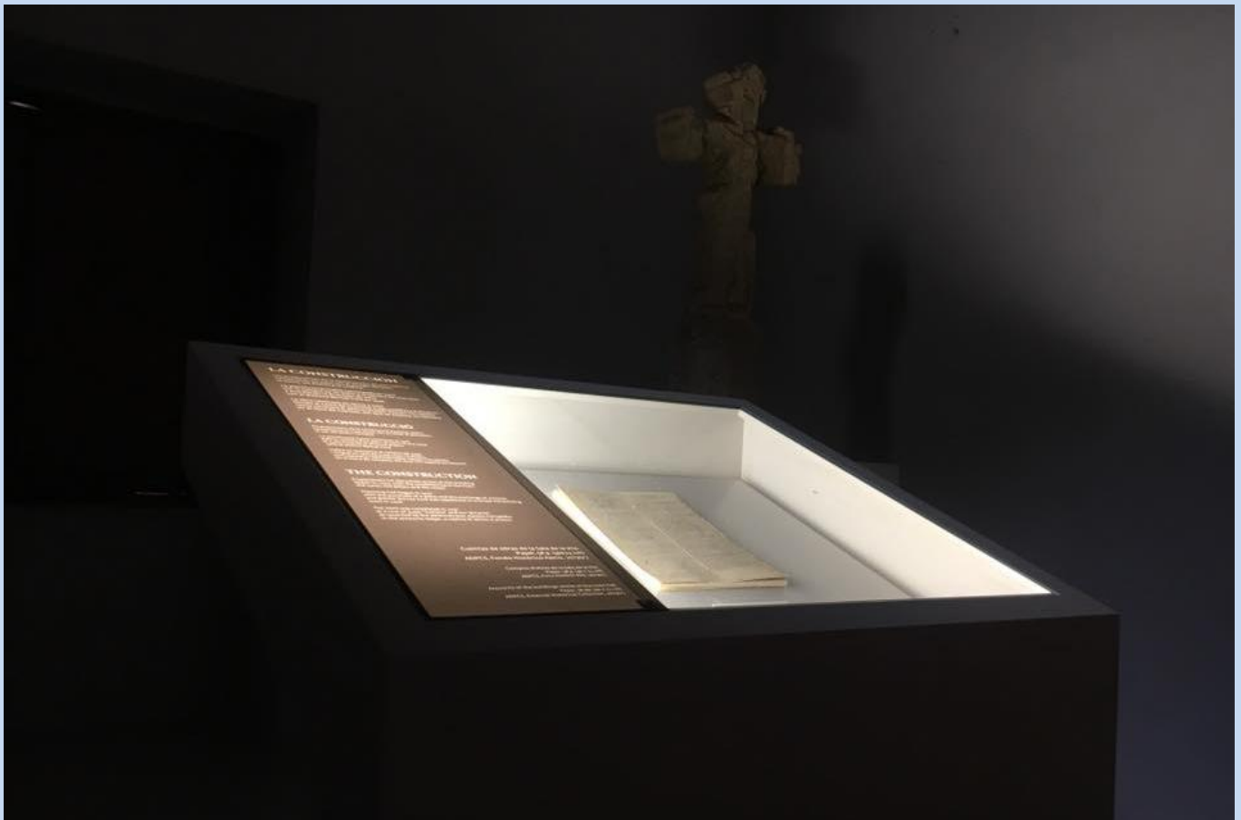
Caixa sobre els comptes de les obres de la Sala la Vila, al fons el Peiró d'Avinyó.