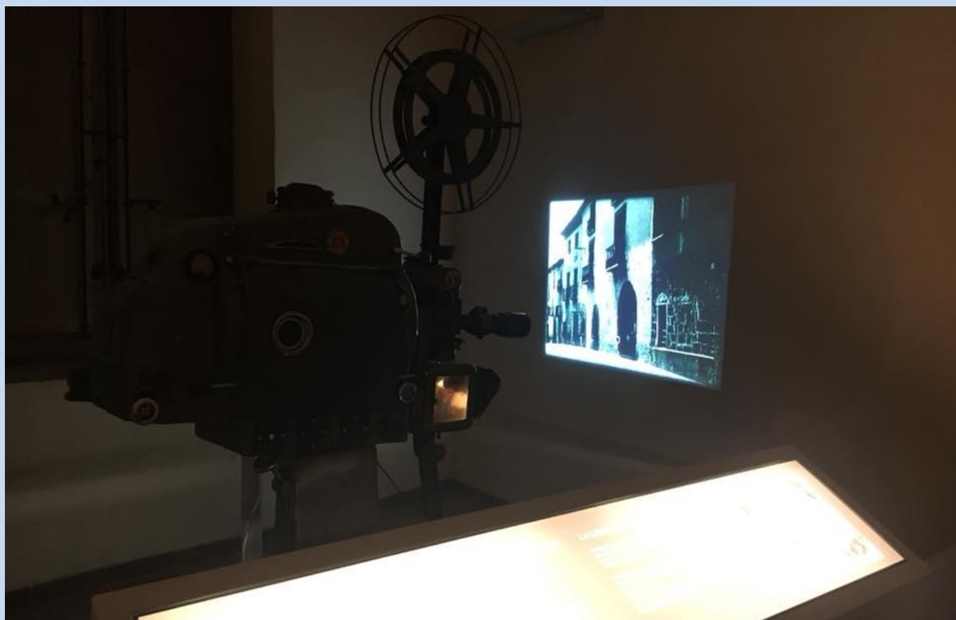
Projecció amb l'antiga màquina de cine del segle XX situada en la Sala de la Vila.