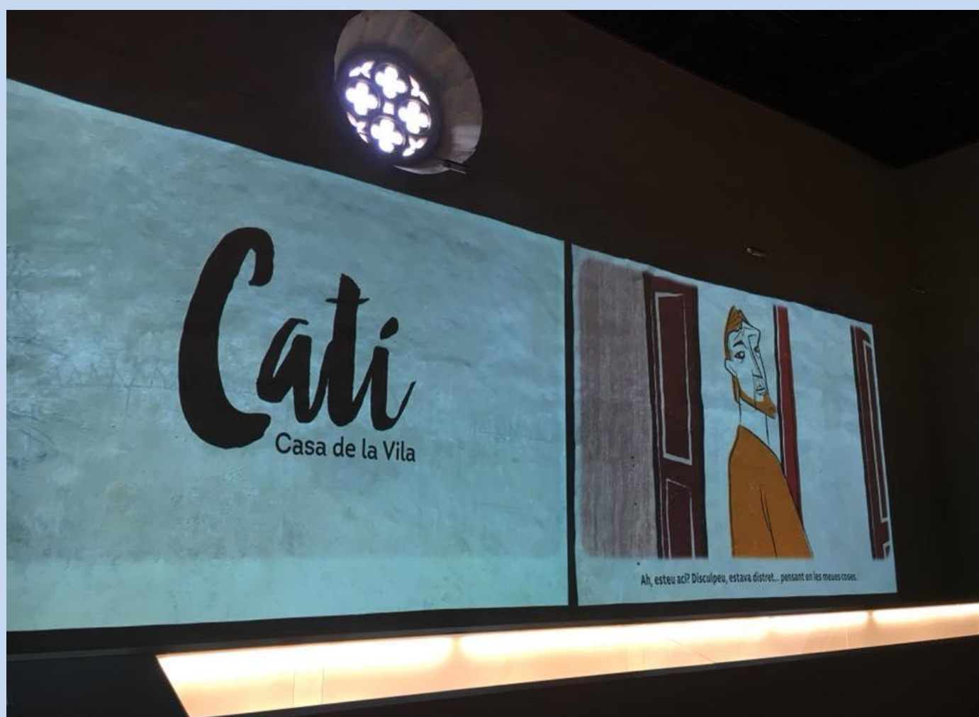
Video sobre la història de Catí en la Sala de la Vila (pis superior de la Llotja).