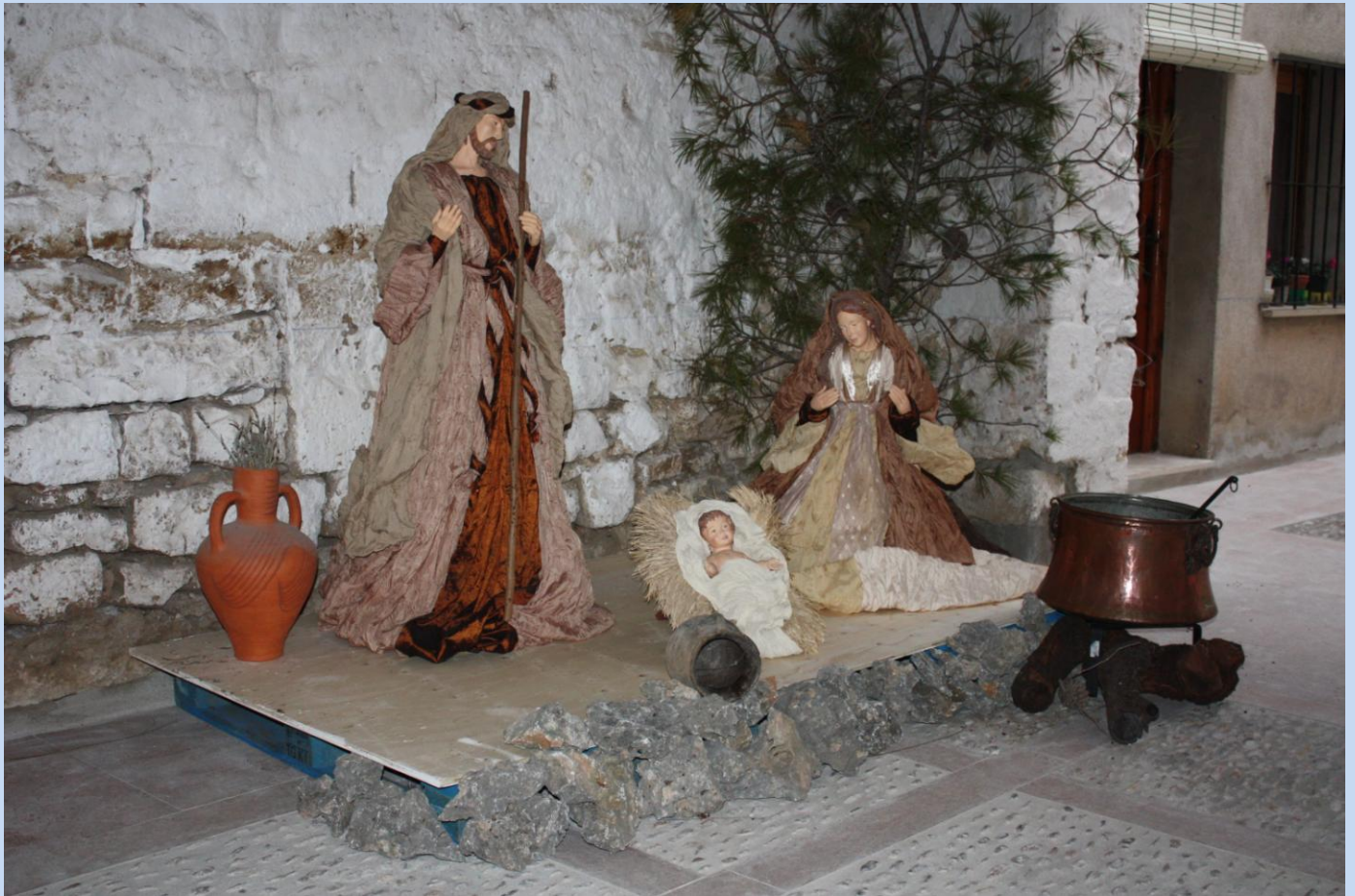
Betlem que s'ha traslladat de la Llotja al pati de la Casa del Delme situat en el carreró de la Plaça de l'església, lateral a l'actual ajuntament.