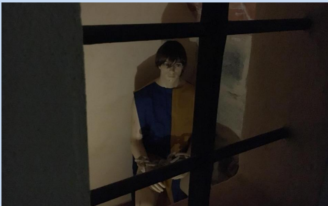
Reproducció de l'antiga presó situada també a la Llotja