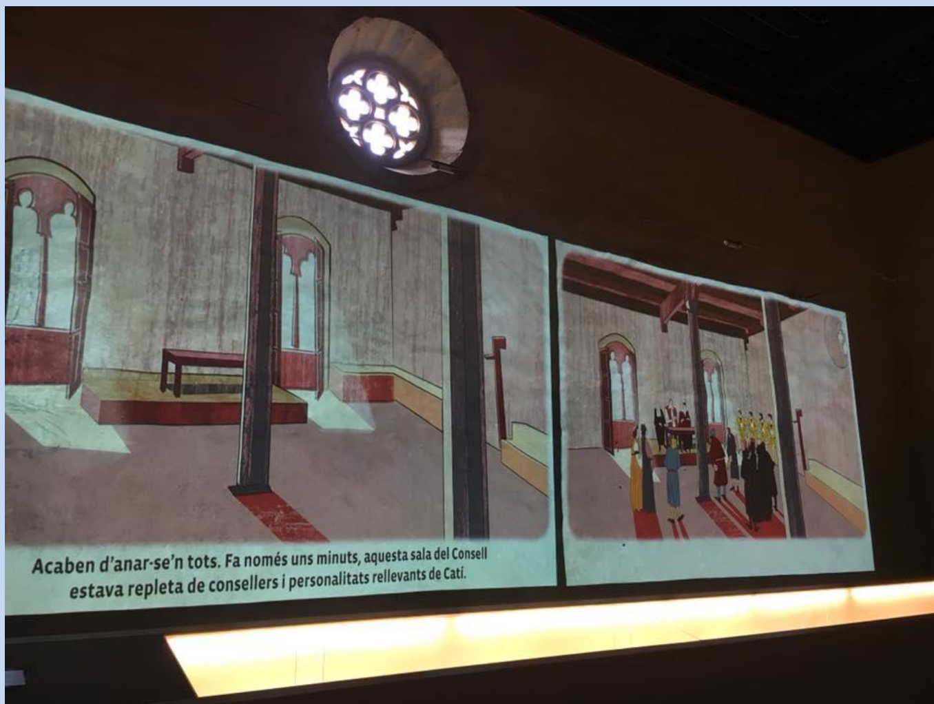
Video sobre la història de Catí