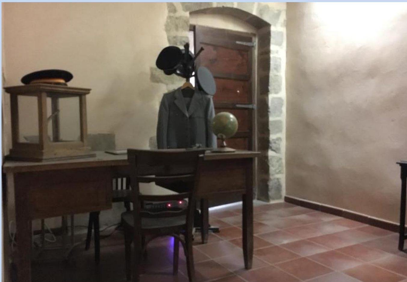
Reproducció de l'antiga oficina de l'antic ajuntament situat molts anys en la Llotja