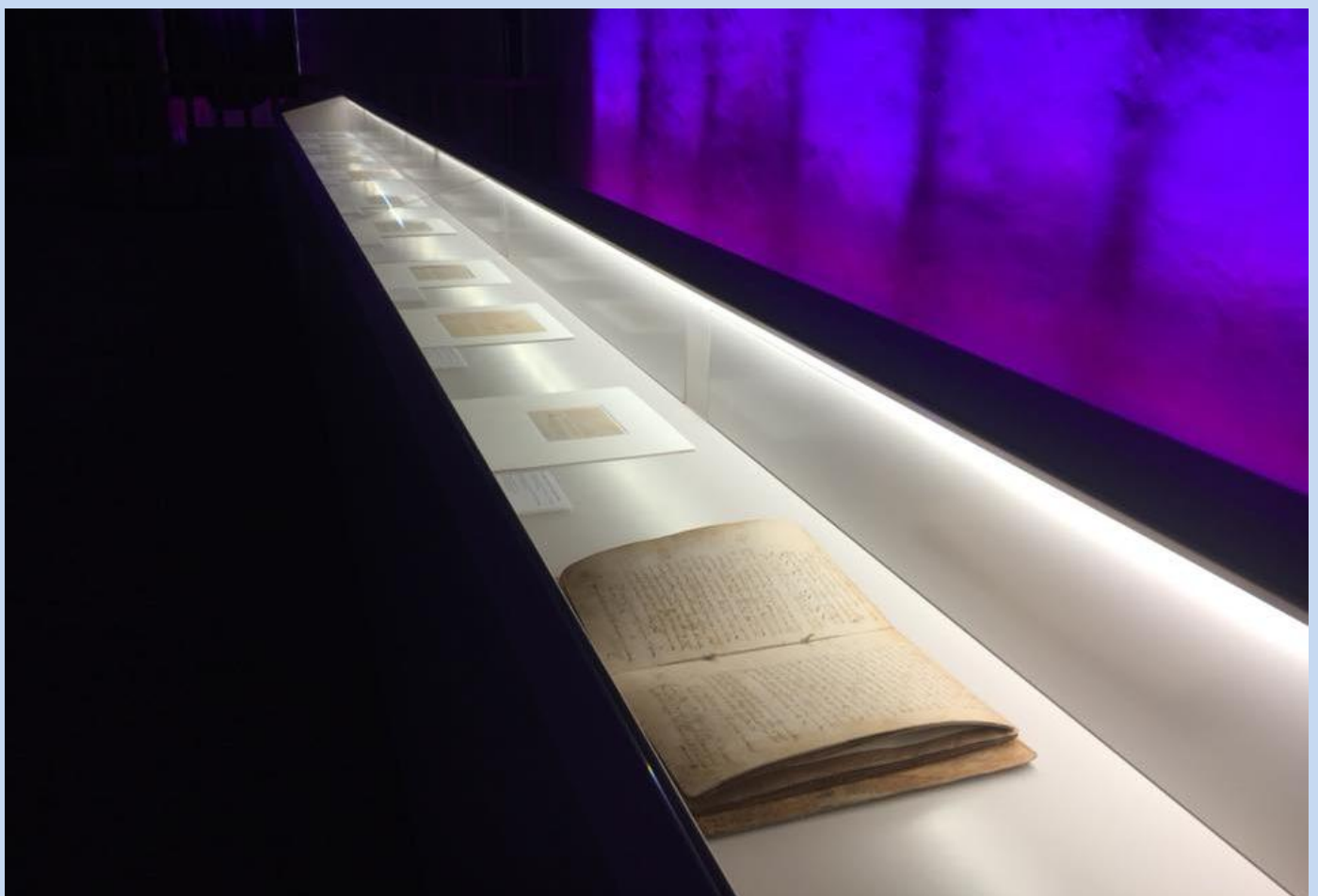
Un altre detall de la fotografia anterior.